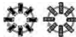
水平・垂直ロールフリー