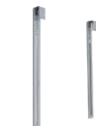
システムパネル引掛 アタッチメント KOWA