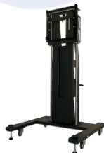
自立型モニタースタンド ARMOR ST-PD04C