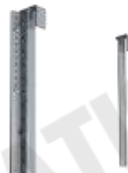
トラス用天吊りアタッチメント KOWA