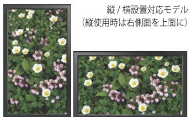
縦 / 横設置対応モデル (縦使用時は右側面を上面に)