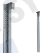
トラス用天吊りアタッチメント KOWA