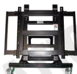
床置きモニタースタンド RATEC PT-1277(光和仕様)