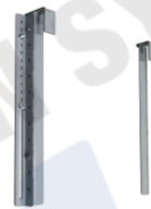
トラス用天吊り アタッチメント