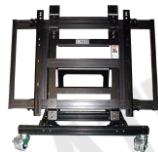
床置きモニタースタンド RATEC PT-1277(光和仕様)